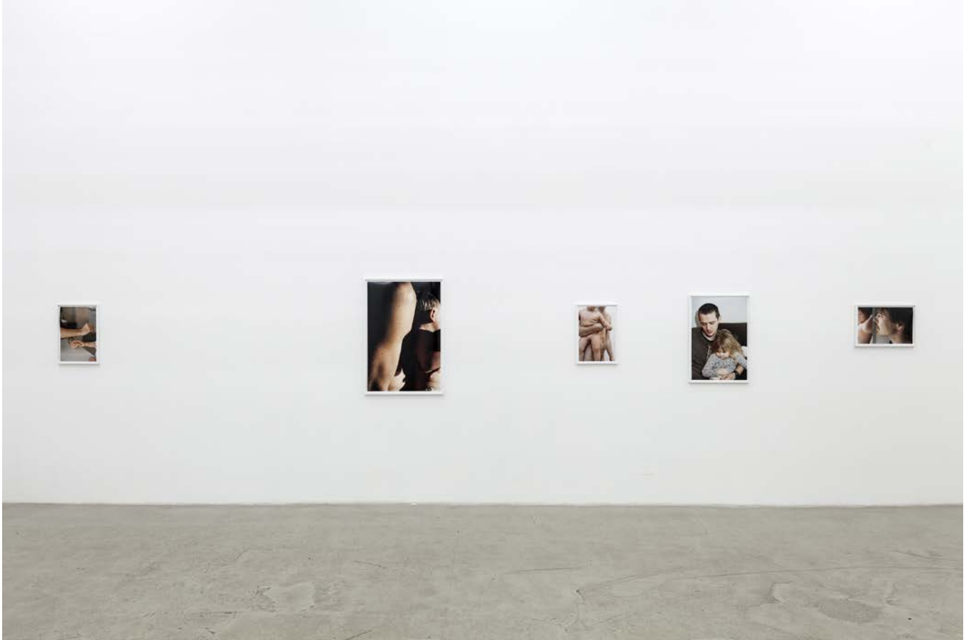
FATHERS 2015, Ansicht, Galerie b2_Leipzig