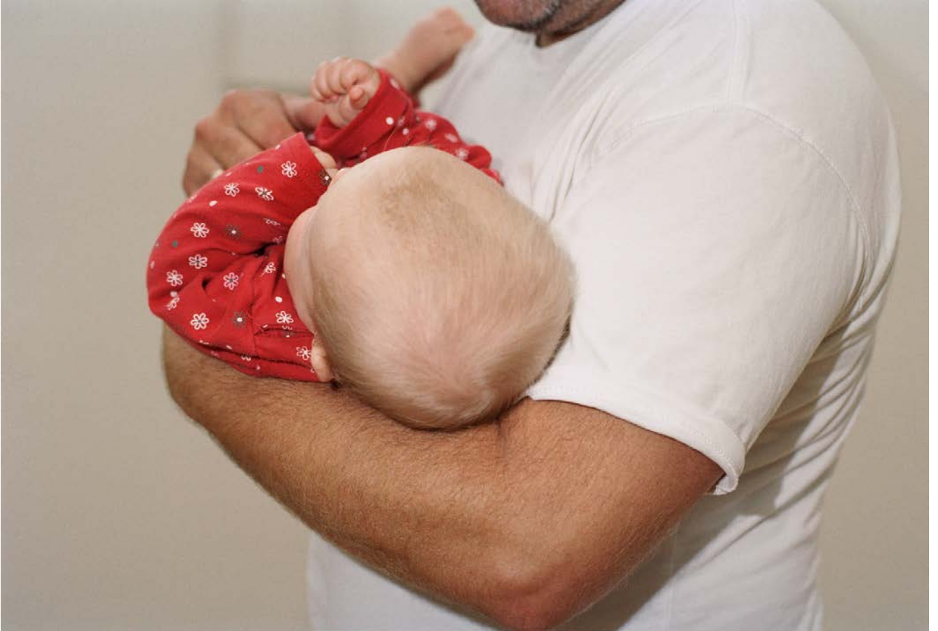
FATHERS 2014, Tintenstrahl Druck 35x50,4 cm