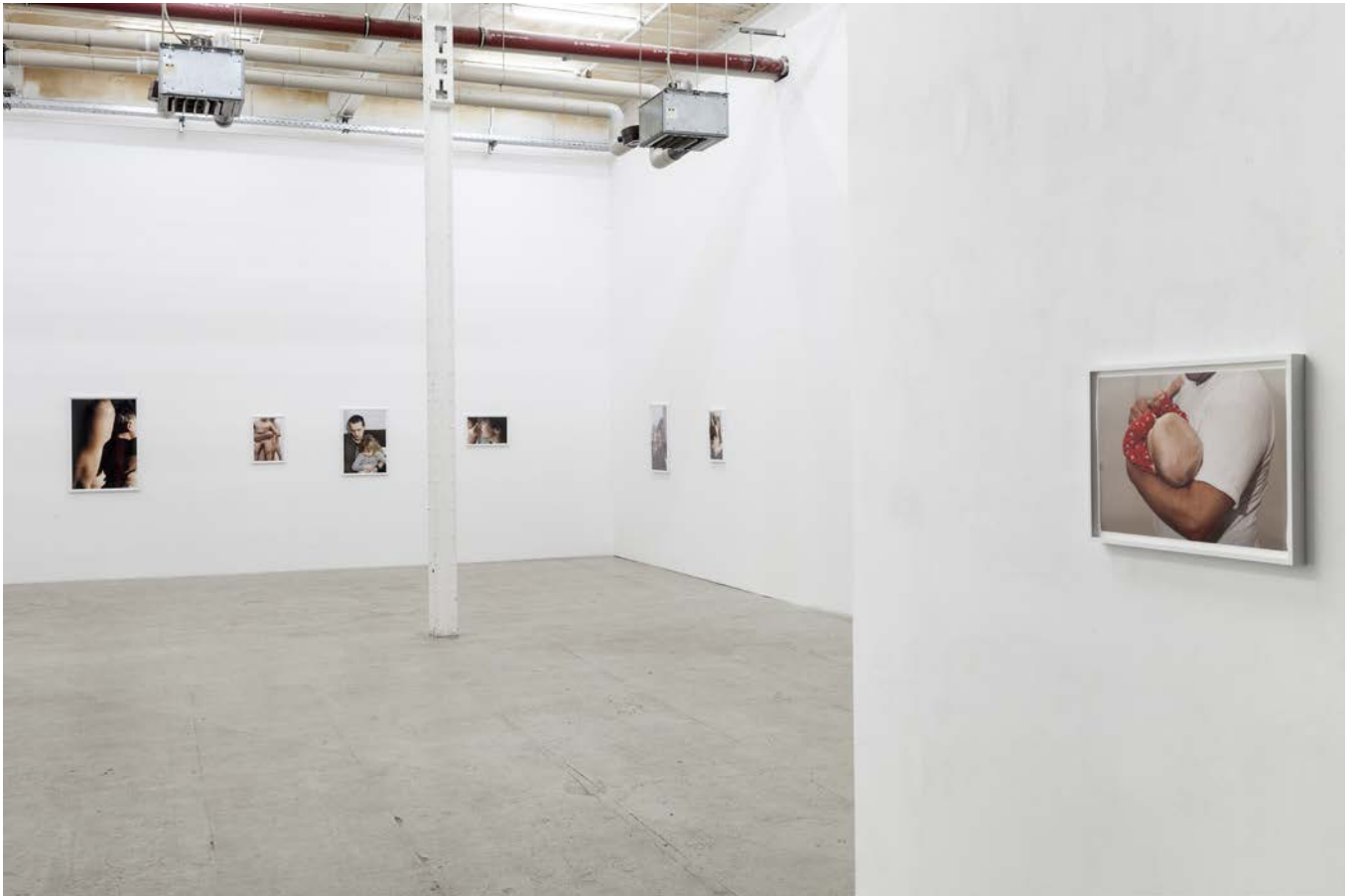
FATHERS 2015, Ansicht, Galerie b2_Leipzig