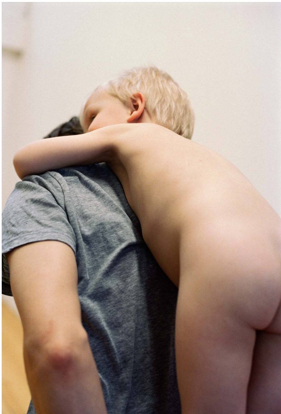
FATHERS 2014, Tintenstrahldruck 98,2×67,3 cm