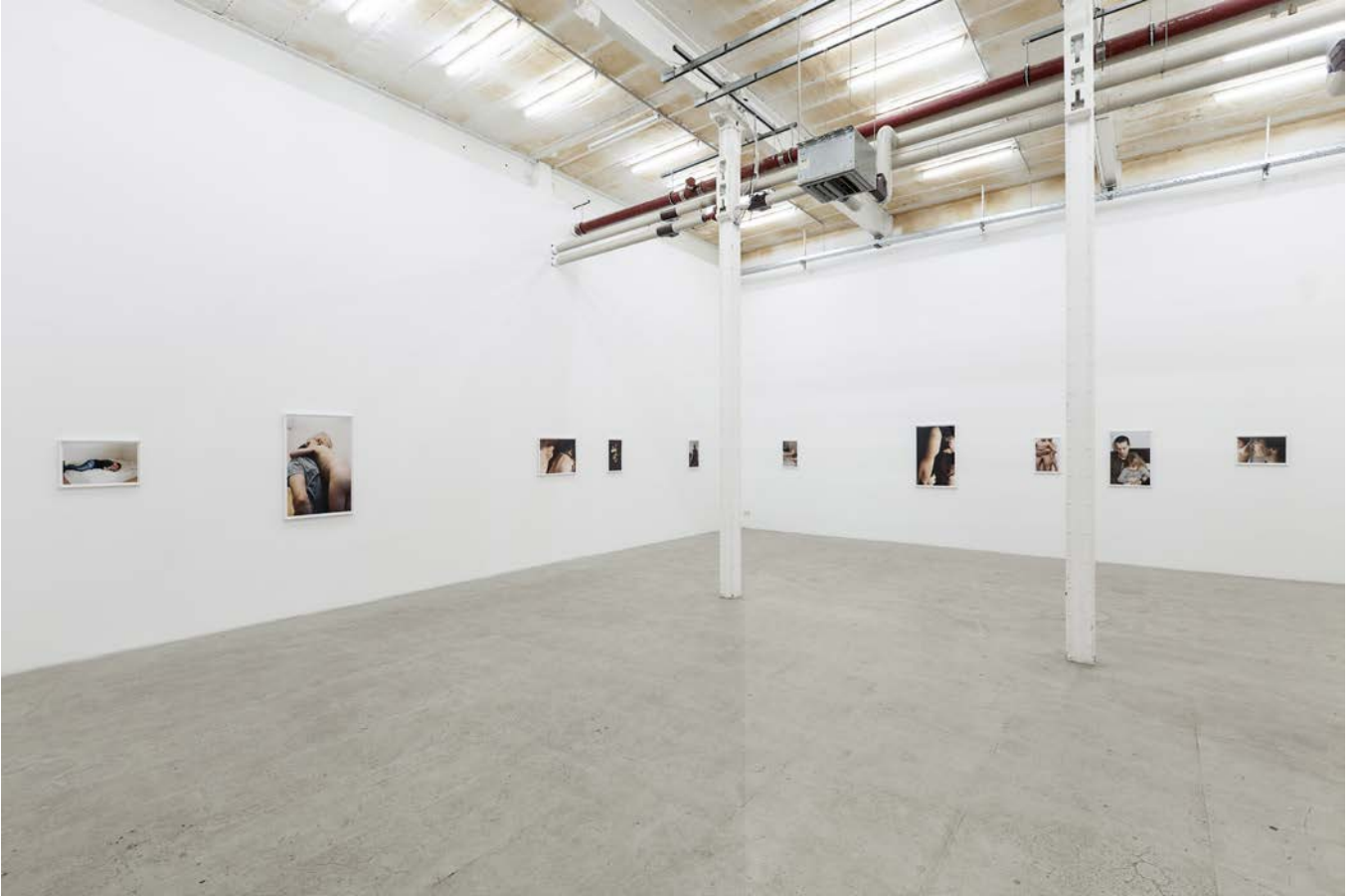
FATHERS 2015, Ansicht, Galerie b2_Leipzig