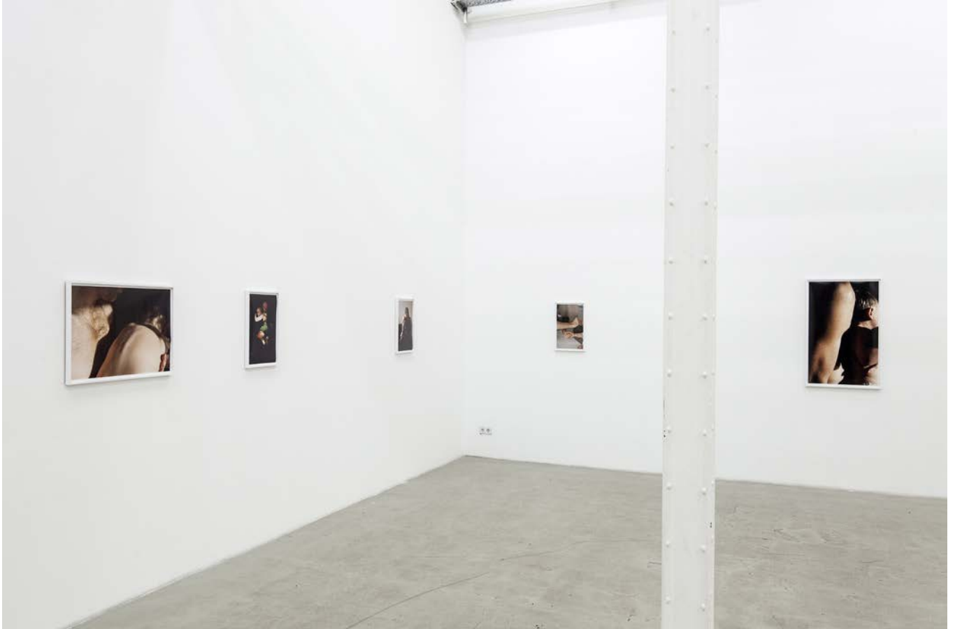
FATHERS 2015, Ansicht, Galerie b2_Leipzig