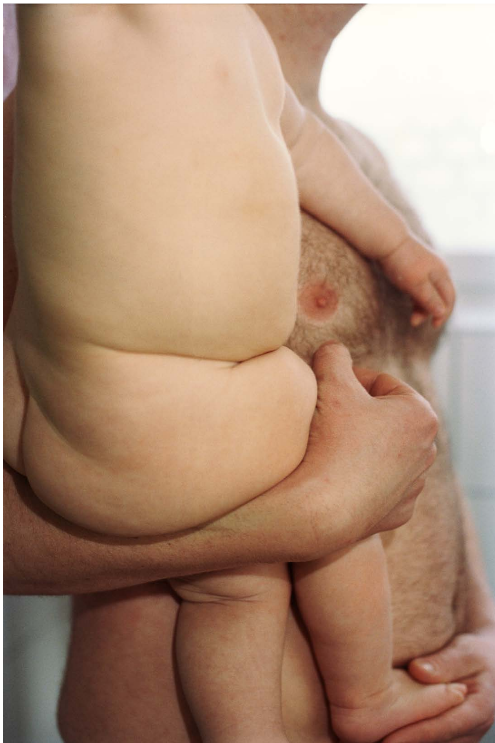
FATHERS 2014, Tintenstrahl Druck 111,4×76,1 cm