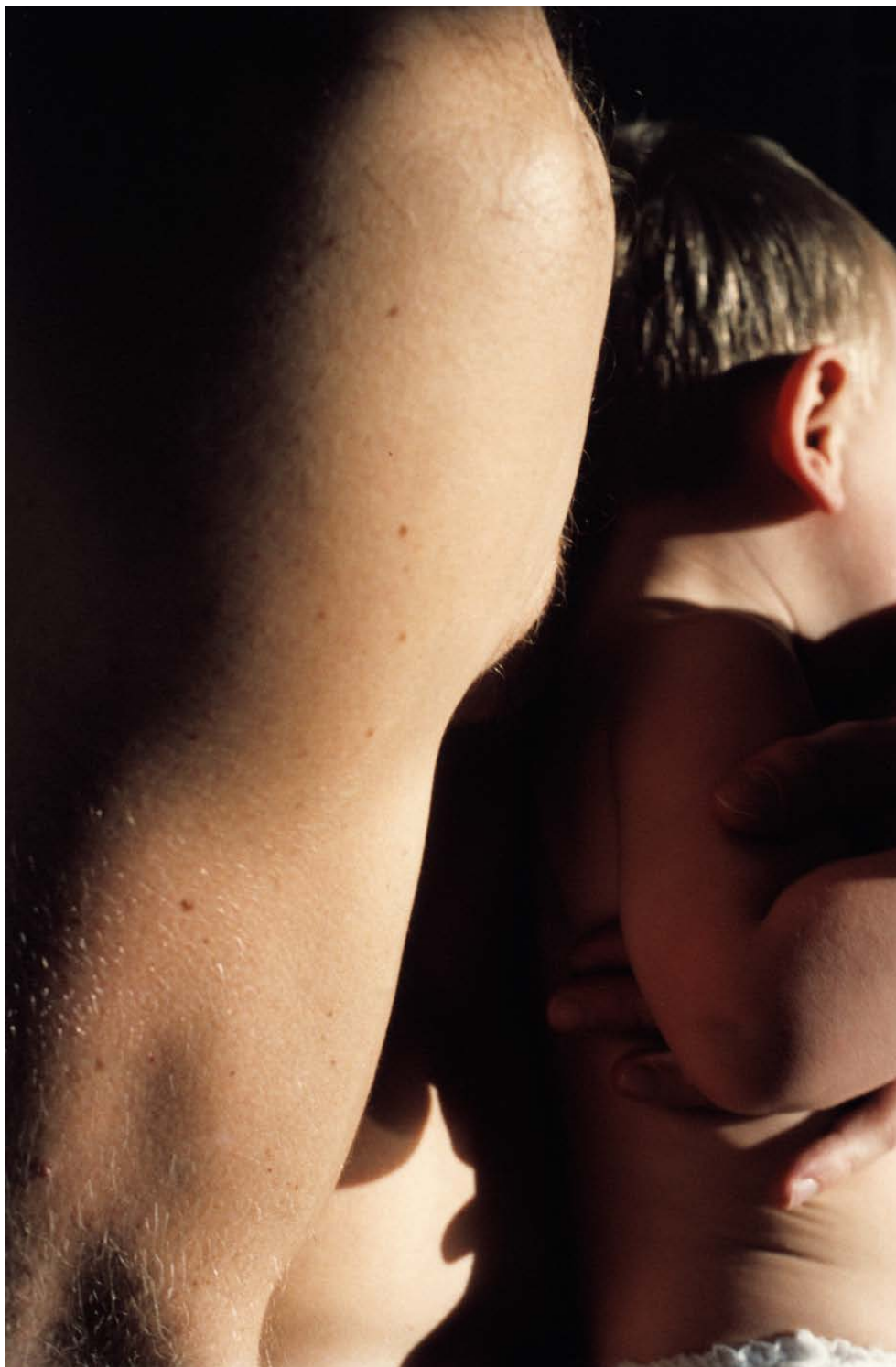
FATHERS 2014, Tintenstrahlruck 98,2×67,3 cm