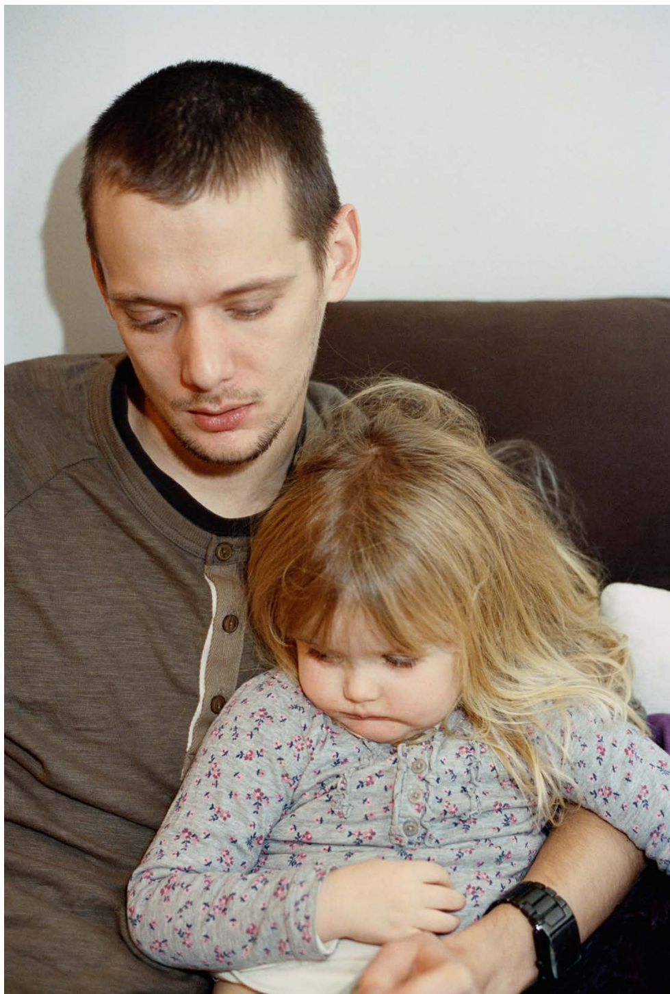
FATHERS 2014, Tintenstrahlruck 74,6×51,6 cm