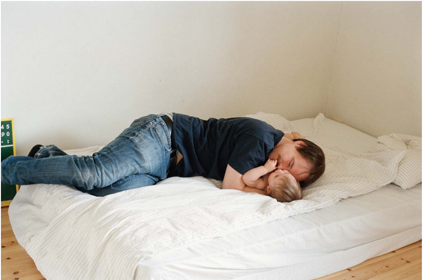
FATHERS 2014, Tintenstrahldruck 35×50,4 cm